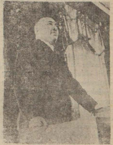
Türk Hava Kurumu Başkanı Şükrü Koçak

İnsanların, şuurunu kaybetmiş yığınlar halinde birbirlerinin üstüne saldırmaları, bu yıl son hıza varmıştır. Türk milleti vatanını kötü ihtiraslardan ve kararsızlıklara düşmekten büyük bir ustalıkla korumasını bilen sayılı milletlerden biridir. Haklarına ve şerefine dokunulmadıkça Türkiyenin, iyilik, fazilet, umran ve düzen yuvası olarak kalacağına artık hiç kimsenin tereddüdü yoktur. Milli Şefinin kudretli idaresi ve şefkatli kanadları altında, yeryüzünün medeniyet ve tekâmül unsuru olan milletimizi harb âfetinin yıkıcılığın, en