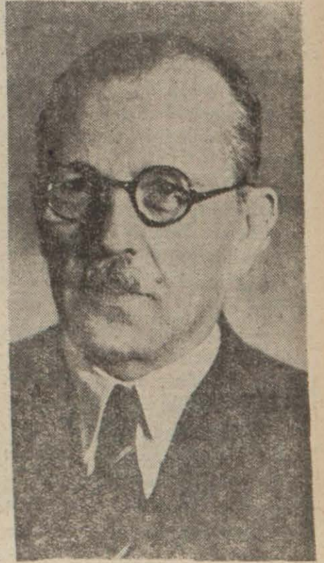
Başvekil Şükrü Saracoğlu